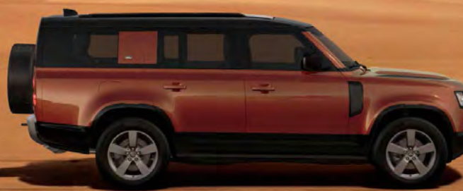
METALLIC SEDONA RED ALLEEN VOOR 130 EN 110 SEDONA EDITION