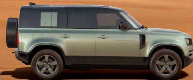
METALLIC PANGEA GREEN