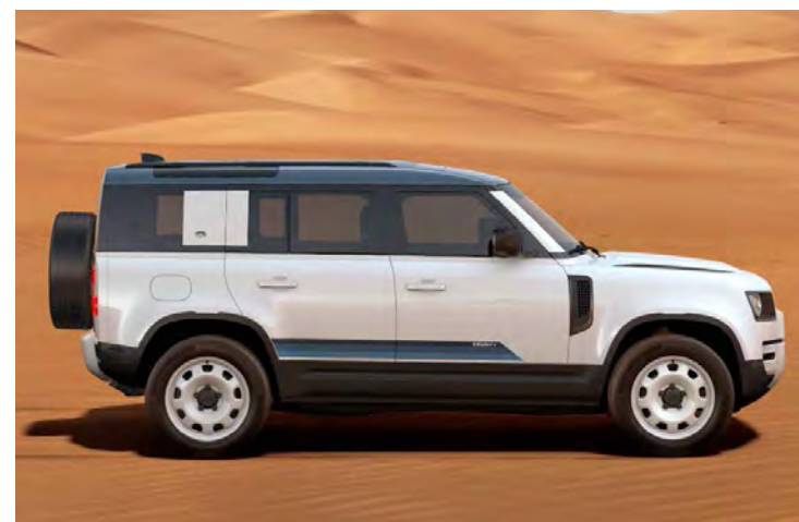
20" 'STYLE 9013' GLOSS WHITE Alleen i.c.m. County Exterior Pack