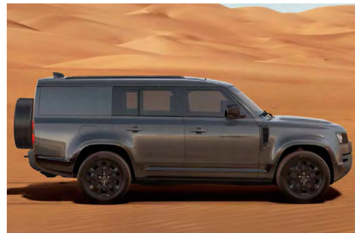
20" 'STYLE 5095' GLOSS BLACK Standaard op Defender 130 Outbound