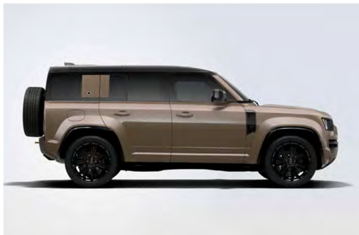
22" 'STYLE 7026' GLOSS BLACK Standaard op Defender OCTA

Er is keuze uit een uitgebreid programma lichtmetalen velgen. De maten variëren van 18" tot een bijzonder aantrekkelijke 22". De markante designkenmerken voegen stuk voor stuk hun specifieke karakter toe aan de uitstraling van de auto. In de configurator op landrover.nl kunt u zien welke velgen beschikbaar zijn voor uw gewenste uitvoering.