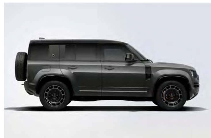
20" 'STYLE 1086' DIAMOND TURNED SATIN DARK FINISH & CONTRAST SATIN BLACK Standaard op Defender OCTA Edition One