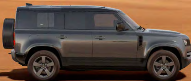
PREMIUM METALLIC CARPATHIAN GREY