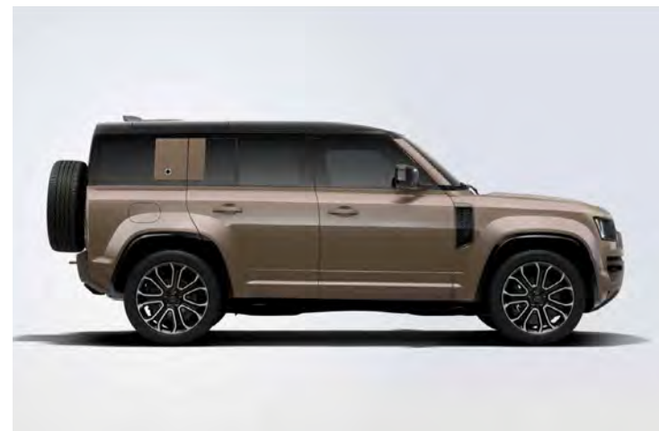
22" 'STYLE 7026' DIAMOND TURNED FINISH & CONTRAST GLOSS BLACK Alleen voor Defender OCTA en Defender OCTA Edition One