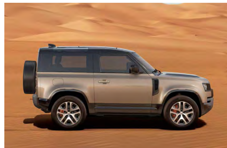
20" 'STYLE 5095' GLOSS DARK GREY & CONTRAST DIAMOND TURNED FINISH