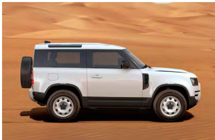
18" STAAL 'STYLE 5093' GLOSS WHITE

Er is keuze uit een uitgebreid programma lichtmetalen velgen. De maten variëren van 18" tot een bijzonder aantrekkelijke 22". De markante designkenmerken voegen stuk voor stuk hun specifieke karakter toe aan de uitstraling van de auto. In de configurator op landover.nl kunt u zien welke velgen beschikbaar zijn voor uw gewenste uitvoering.