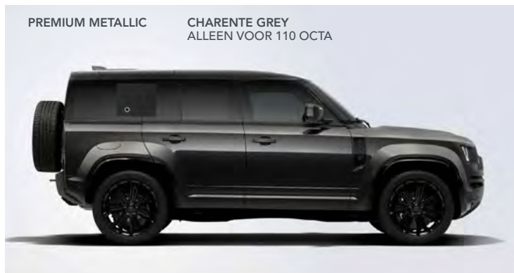
PREMIUM METALLIC CHARENTE GREY ALLEEN VOOR 110 OCTA