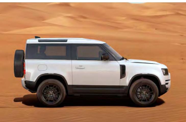
19" 'STYLE 6010' GLOSS BLACK