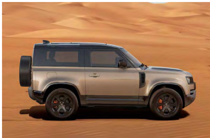
20" 'STYLE 6011' GLOSS BLACK

Er is keuze uit een uitgebreid programma lichtmetalen velgen. De maten variëren van 18" tot een bijzonder aantrekkelijke 22". De markante designkenmerken voegen stuk voor stuk hun specifieke karakter toe aan de uitstraling van de auto. In de configurator op landover.nl kunt u zien welke velgen beschikbaar zijn voor uw gewenste uitvoering.