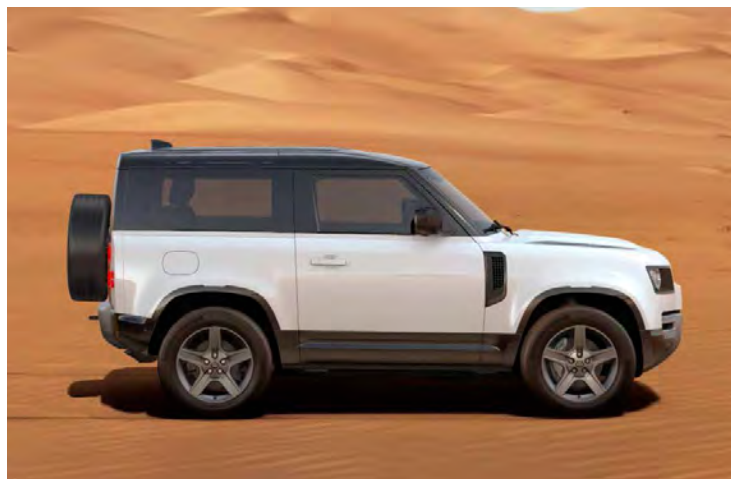
20" 'STYLE 5094' SATIN DARK GREY Standaard op Defender X-Dynamic SE

Er is keuze uit een uitgebreid programma lichtmetalen velgen. De maten variëren van 18" tot een bijzonder aantrekkelijke 22". De markante designkenmerken voegen stuk voor stuk hun specifieke karakter toe aan de uitstraling van de auto. In de configurator op landover.nl kunt u zien welke velgen beschikbaar zijn voor uw gewenste uitvoering.