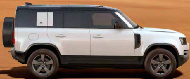
SOLID FUJI WHITE