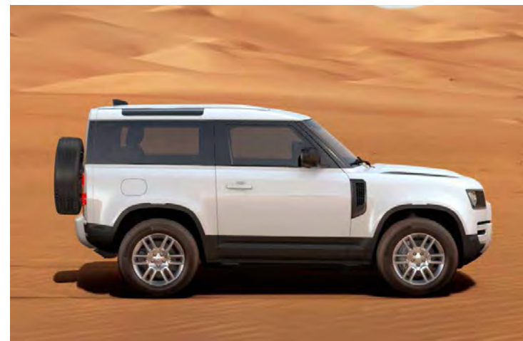
19" 'STYLE 6010' GLOSS SPARKLE SILVER Standaard op Defender S