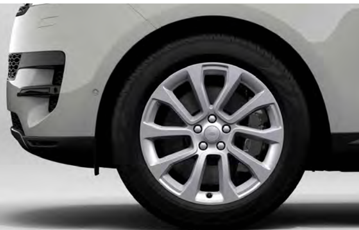
21" 'STYLE 5126' GLOSS SPARKLE SILVER Standaard op Range Rover Sport SE