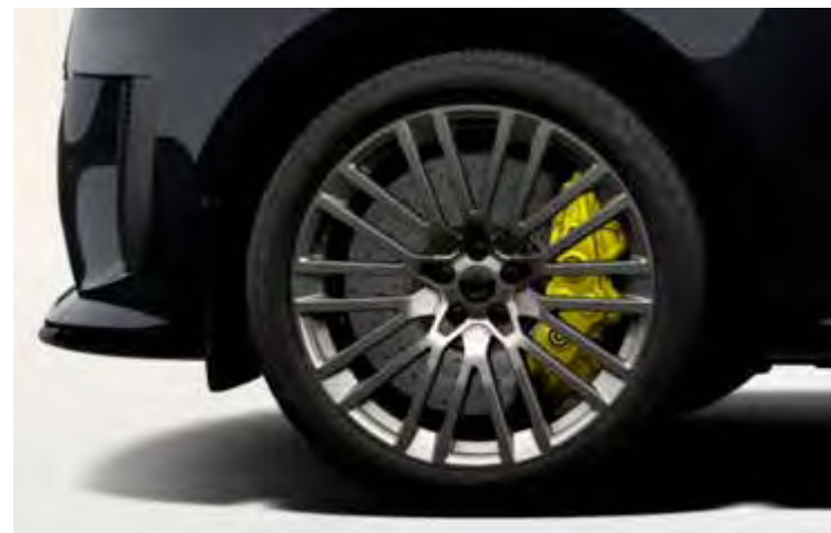
23" 'STYLE 1084' GESMEED POLISHED DARK GREY Alleen voor Range Rover Sport SV EDITION TWO