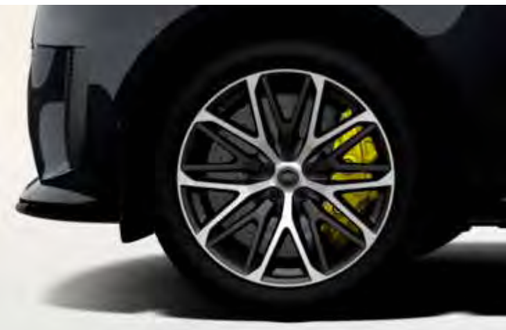
22" 'STYLE 1083' DIAMOND TURNED FINISH & CONTRAST SATIN DARK GREY Alleen voor Range Rover Sport SV EDITION TWO

Er is keuze uit een uitgebreid programma lichtmetalen velgen. De maten variëren van 20" tot een bijzonder aantrekkelijke 23". De markante designkenmerken voegen stuk voor stuk hun specifieke karakter toe aan de uitstraling van de auto. In de configurator op landover.nl kunt u zien welke velgen beschikbaar zijn voor uw gewenste uitvoering.