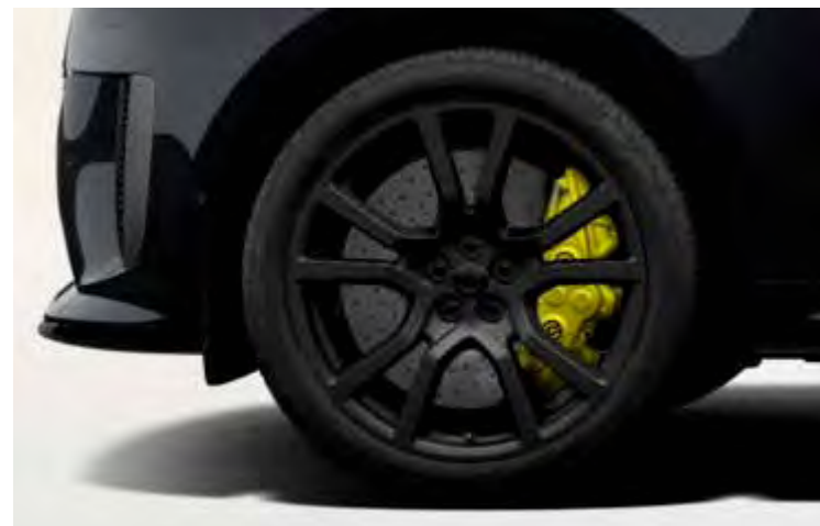
23" 'STYLE 5132' CARBON FIBRE SATIN GREY TINTED FINISH Alleen voor Range Rover Sport SV EDITION TWO