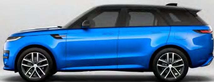
ULTRA METALLIC VELOCITY BLUE HOOGGLANS OF SATIJNGLANS