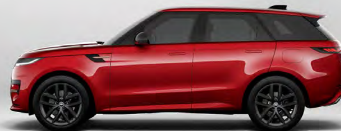
METALLIC FIRENZE RED