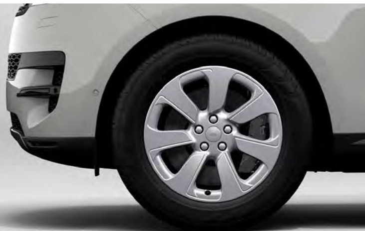
20" 'STYLE 7020' GLOSS SPARKLE SILVER Standaard op Range Rover Sport S

Er is keuze uit een uitgebreid programma lichtmetalen velgen. De maten variëren van 20" tot een bijzonder aantrekkelijke 23". De markante designkenmerken voegen stuk voor stuk hun specifieke karakter toe aan de uitstraling van de auto. In de configurator op landrover.nl kunt u zien welke velgen beschikbaar zijn voor uw gewenste uitvoering.