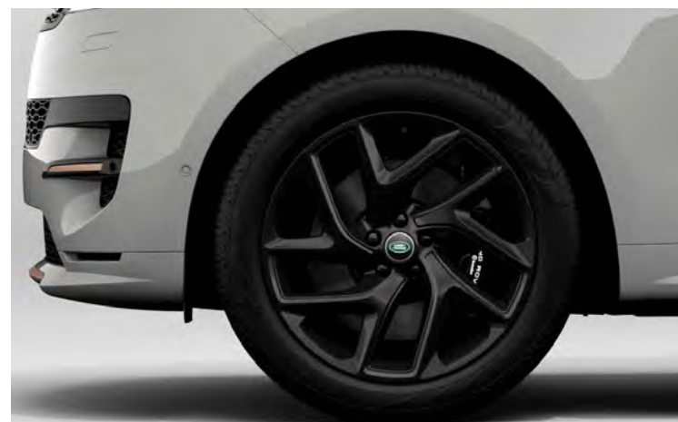
22" SV BESPOKE 'STYLE 5131' SATIN BLACK & CONTRAST GLOSS BLACK