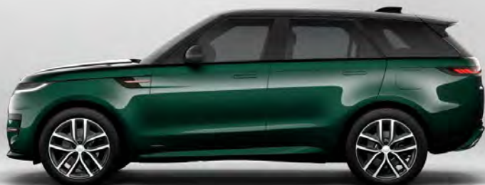
ULTRA METALLIC BRITISH RACING GREEN HOOGGLANS OF SATIJNGLANS