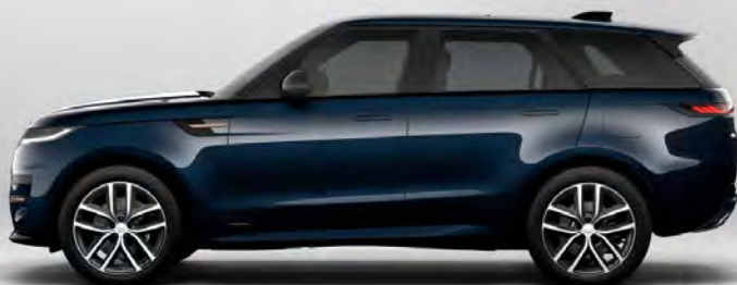
ULTRA METALLIC CONSTELLATION BLUE HOOGGLANS