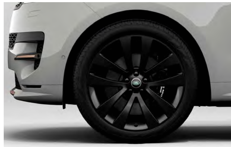
23" 'STYLE 5135' GLOSS BLACK