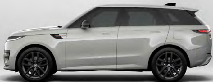
SOLID FUJI WHITE