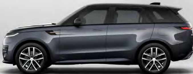
ULTRA METALLIC AMETHYST GREY-PURPLE HOOGGLANS