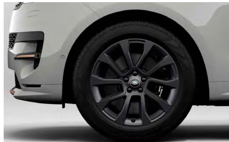
21" 'STYLE 5126' SATIN DARK GREY Standaard op Range Rover Sport Dynamic SE