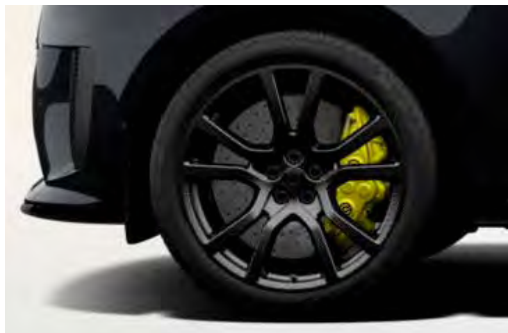
23" 'STYLE 5132' CARBON FIBRE GLOSS DARK TINTED FINISH Alleen voor Range Rover Sport SV EDITION TWO

Er is keuze uit een uitgebreid programma lichtmetalen velgen. De maten variëren van 20" tot een bijzonder aantrekkelijke 23". De markante designkenmerken voegen stuk voor stuk hun specifieke karakter toe aan de uitstraling van de auto. In de configurator op landrover.nl kunt u zien welke velgen beschikbaar zijn voor uw gewenste uitvoering.