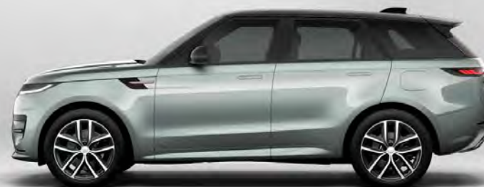
ULTRA METALLIC IONIAN SILVER HOOGGLANS OF SATIJNGLANS