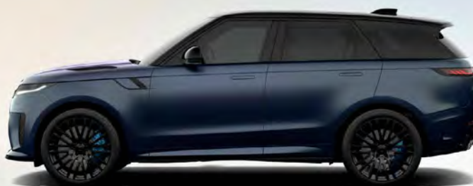
ULTRA METALLIC BLUE NEBULA MATTE SATIJNGLANS