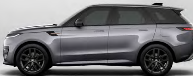
METALLIC EIGER GREY HOOGGLANS OF SATIJGLANS