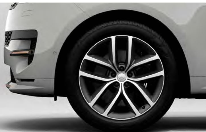
22" SV BESPOKE 'STYLE 5127' DIAMOND TURNED FINISH & CONTRAST SATIN DARK GREY Standaard op Range Rover Sport Autobiography