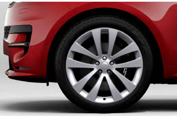
23" 'STYLE 5135' GLOSS SPARKLE SILVER