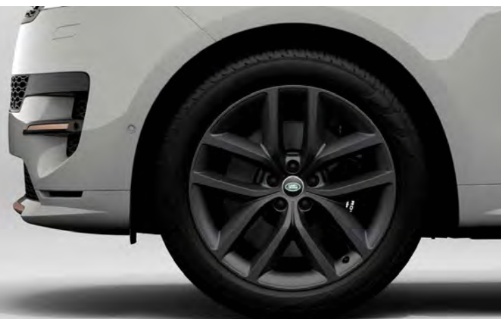
22" 'STYLE 5127' SATIN DARK GREY Standaard op Range Rover Sport Dynamic HSE