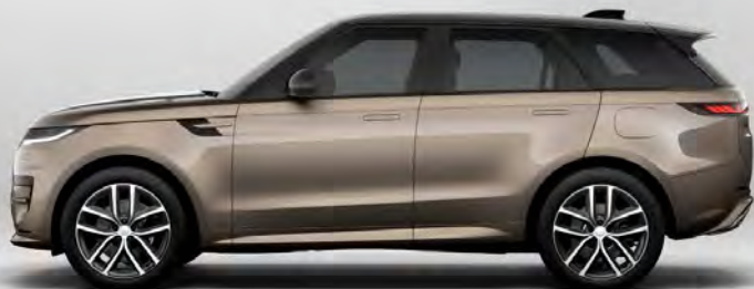
ULTRA METALLIC SUNSET GOLD HOOGGLANS OF SATIJNGLANS