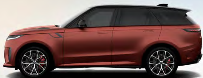
ULTRA METALLIC SUNRISE COPPER SATIN SATIJNGLANS