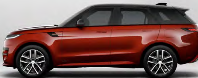
ULTRA METALLIC SUNRISE COPPER HOOGGLANS OF SATIJNGLANS