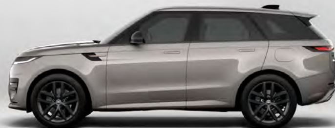
METALLIC BORASCO GREY