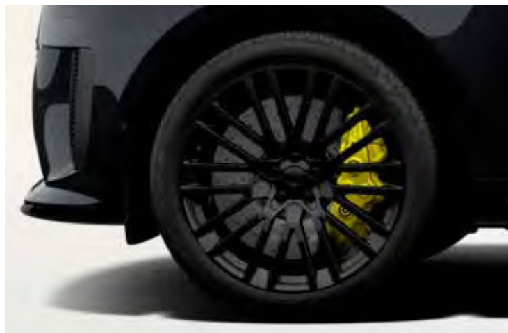
23" 'STYLE 1084' GESMEED DUO TONE SATIN/GLOSS BLACK Alleen voor Range Rover Sport SV EDITION TWO