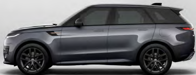
METALLIC VARESINE BLUE